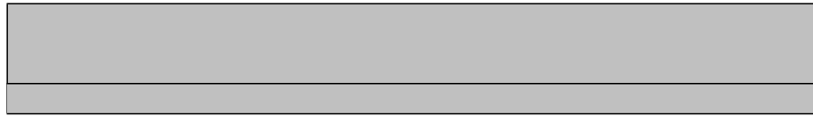
Tablas III.E.5: Secuencias curriculares propuestas para los Planes de Estudio---Estudiantes a Tiempo Parcial