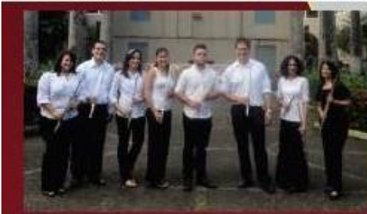
A r u cionesdelDe artamentode Musica